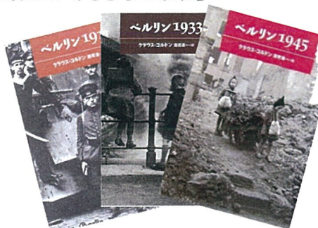
クラウス・コルドン著 酒寄進一訳 933/コル 理論社